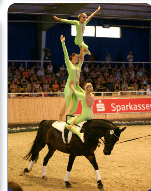
Afb. 7 - Voltigeren

In de Euregio is de ruitersport in alle opzichten een geliefde hobby. Vooral in streken met veel groen en weinig verkeer, zoals in Oost-België, vind je talrijke boerderijen die paarden verhuren. Ze bieden ook cursussen aan voor beginners en organiseren zelfs meerdaagse ruitertochten.