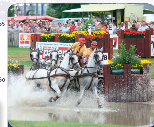
Afb. 5 - Mennen

De mascotte van het CHIO is een groot pluchen paard en heet “Karli” (afb. 7). Bedenk een mascotte die qua uiterlijk en naam goed bij jullie school past!