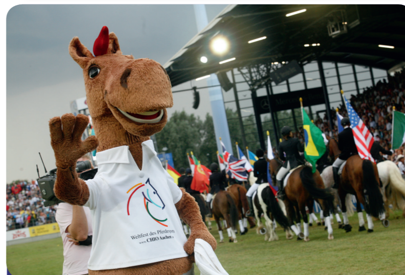
Afb. 6 - Mascotte Karli