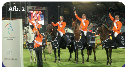
Afb. 2 Winnaar van de prijs der naties 2011. Waar komt het oranje team vandaan?

CHIO – achter deze letters schuilt het belangrijkste ruitertoernooi ter wereld, dat iedere zomer midden in de Euregio plaatsvindt. Soers, waar het stadion van de “Aachen-Laurensberger Rennverein” staat, is daarom bij alle liefhebbers van de paardensport bekend. Om de beste paarden en ruiters ter wereld eens van heel dichtbij te kunnen aanschouwen, komt men van heinde en ver.