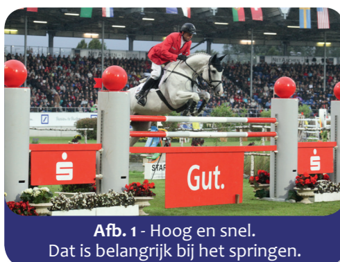
Afb. 1 - Hoog en snel. Dat is belangrijk bij het springen.

Veel van deze toeschouwers komen natuurlijk uit België, Duitsland en Nederland. Het is voor hen tenslotte dichtbij en deze landen zijn bovendien bijzonder succesvol. De ruitersport is eigenlijk een sport die alleen, of eigenlijk met zijn tweeën, wordt beoefend en iedere ruiter vertegenwoordigt altijd zijn of haar land. Bij de huldiging wordt voor de winnaar het volkslied van het winnende land gespeeld.