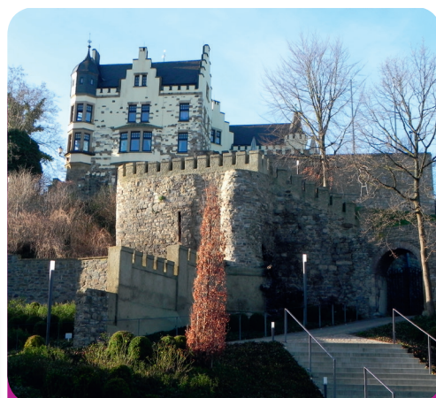
Fig. 2: Le château de Rode. C'est ici qu'avaient lieu les procès des «Bockreiter».