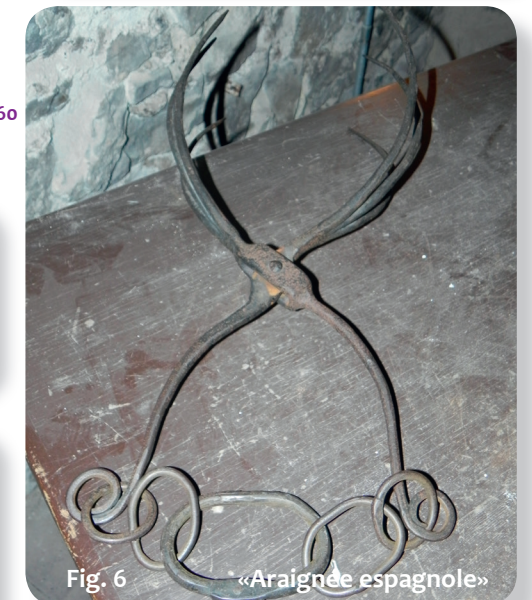
Fig. 6 «Araignée espagnole»

Dans les caves du château de Rode, à Herzogenrath (Fig. 2 et 5, burgrode.de ) tu pourras voir un cachot et des instruments de torture. Une belle occasion pour visiter : fête ton anniversaire avec de «véritables» chevaliers !