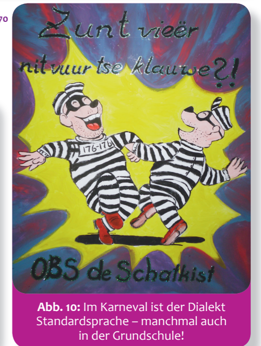
Abb. 10: Im Karneval ist der Dialekt Standardsprache – manchmal auch in der Grundschule!

Puppentheater in Lüttich (Tchantchès) und die Stadtpuppenbühne Aachen (Öcher Schängchen)