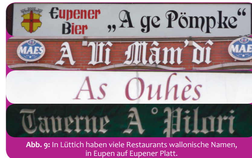
Abb. 9: In Lüttich haben viele Restaurants wallonische Namen, in Eupen auf Eupener Platt.

Dialekte sind wertvoll, weil sie ein Stück Vielfalt bewahren. Politiker und Wissenschaftler sprechen oft von „kulturellem Erbe“ – und das sind Dialekte wirklich. Kannst du dir vorstellen, was damit gemeint ist?