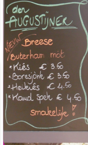
Speisekarte in Bree