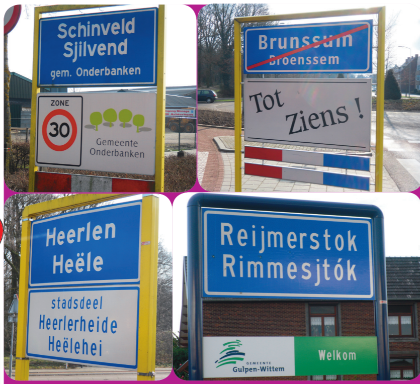
Abb. 2: In Süd-Limburg (NL) sind die meisten Ortsschilder zweisprachig: Niederländisch und Limburgisch

Dialekte unterscheiden sich dagegen 15 von Dorf zu Dorf. Das bedeutet: Je weiter zwei Orte auseinander liegen, desto schwerer ist es für die Einwohner dieser beiden Orte, sich untereinander zu verstehen. Umgekehrt heißt das 20 auch: Meist versteht man die Menschen aus dem Nachbarort gut, wenn sie