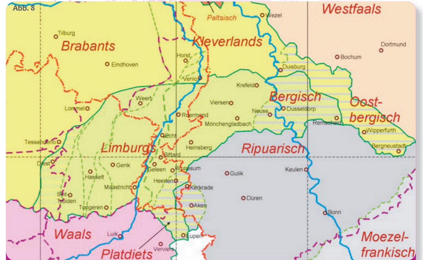
So teilen unsere Wissenschaftler unsere Dialekte ein. Muss man nicht verstehen, kann man aber mal gesehen haben!