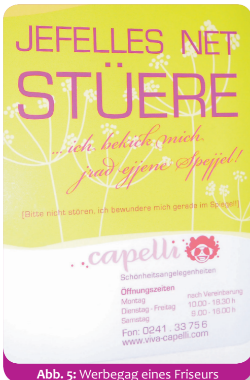
Abb. 5: Werbegag eines Friseurs

Im französischsprachigen Teil Belgiens werden „wallonische“ Dialekte gesprochen. Wallonisch ist die Sprache, die früher in Südbelgien (der Wallonie) gesprochen wurde. Es ist mit dem Französischen verwandt, aber hört sich ganz anders an und sieht geschrieben auch ganz anders aus. Bis vor ca. 100 Jahren haben noch fast alle Wallonen im Alltag auch Wallonisch gesprochen – heute können das nur noch wenige. Aber dafür gibt es ca. 200 kleinere Theater, die für mehr als 200.000 Zuschauer im Jahr 60 Stücke auf Wallonisch spielen. Außerdem gibt es in den Grundschulen immer öfter Wallonischkurse. Und wen freut es besonders, wenn die Kinder beim Schulfest ein Gedicht im Dialekt vortragen? Die Großeltern natürlich!