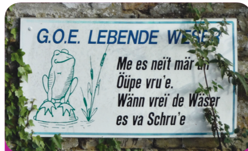
Abb. 6: Hier wird im Dialekt dazu aufgerufen, das Wasser der Weser zu schützen

Von vielen Vornamen gibt es eine Dialektform. Versuche möglichst viele zu finden!